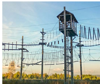
LANOVÁ CENTRA A PARKY