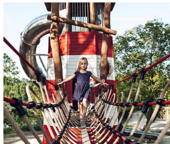
VELKÁ DĚTSKÁ HŘIŠTĚ