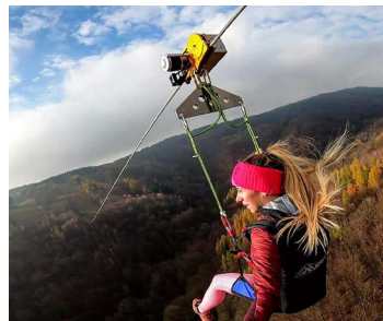
ZIPLINE A DALŠÍ ATRAKCE